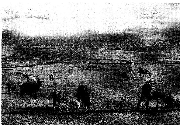
写真2 標高3,000 mを越す夏営地